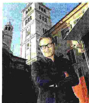
A sinistra Massimo Cacciari, sopra Massimo Recalcati e a destra una gremitissima piazza di Modena